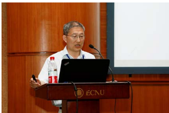
英国伦敦大学学院巴特勒讲座教授吴缚龙博士做大会主题报告

16日下午、17日上午，18日全天及19日上午分别进行了分会场报告。经过组委会审稿接收的115个学术报告围绕会议主题以及相关议题开展了热烈的